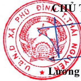
Luong Thế Đồng